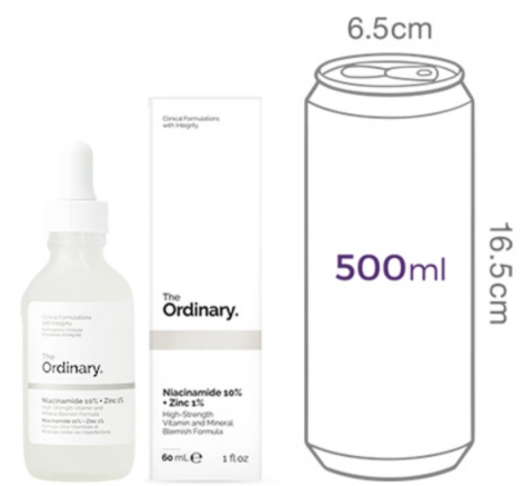
디오디너리 나이아신아마이드 10% + 징크 1% 60mL